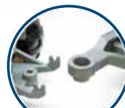
CARRETINHA COM DESENGATE