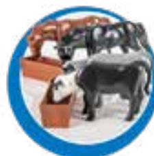
2 vaquinhas 2 cavalos 2 bezerros 2 cochos