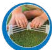
12 módulos de cerca