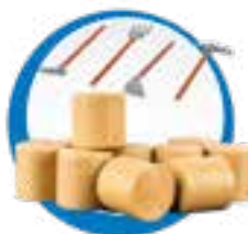
1 picareta 1 enxada 1 pá 1 rastel 10 unidades de feno