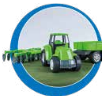
1 trator, 1 arado 1 carretinha com caçamba