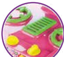
BOTÕES COM MOVIMENTO