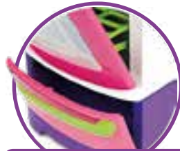
PORTINHAS QUE ABREM E FECHAM