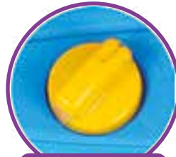
BOTÕES COM MOVIMENTO