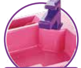
TORNEIRINHA COM MOVIMENTO