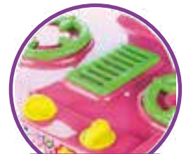
BOTÕES COM MOVIMENTO