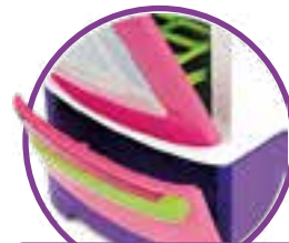
PORTINHAS QUE ABREM E FECHAM